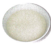
粥湯/肉湯/魚湯/菜湯