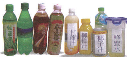
無渣飲料/無渣果汁